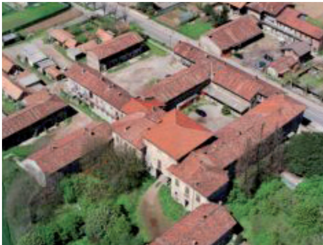
Panoramica del complesso di Villa Agnesi